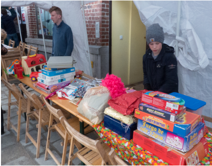
Vue partielle des jouets

Les jouets collectés durant l'Avent ont fait bien des heureux parmi des enfants de ces familles