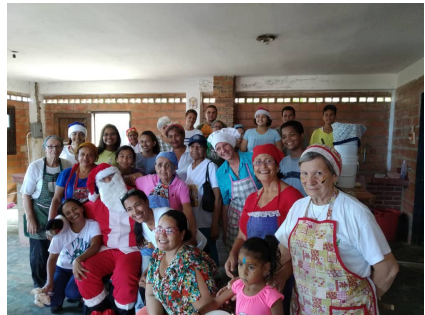
Les volontaires de Caritas

Grace à la générosité des paroissiens le Père Néné a pu repartir avec large colis de médicaments tels que antibiotiques, probiotiques, deux appareils pour mesurer la glycémie de patients atteints de diabète des semences etc.